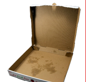
ប្រអប់នំភីសា