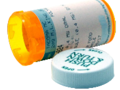
ដបវេជ្ជបញ្ជាណាមួយក្រចក