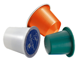
ប៉ាន់កាហ្វេ