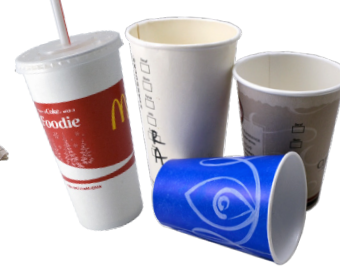
ពែងក្រដាស