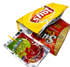
សំបករួចខ្ទប់ធ្វើពីជីវចាស្និកហ្វាយ