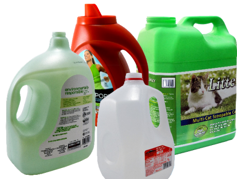
ក្រឡ (គ្មានគំរូប)