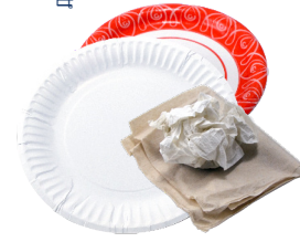
ចានក្រដាស ក្រដាសដូតមាត់ដៃ ក្រដាសកន្សែង

របស់ប្រើប្រាស់តែមួយដង: សូមមើលគេហទំព័រ WasteFree253.org សំរាប់គន្លឹះក្នុងការកាត់បន្ថយនិងលុបបំបាត់ចោលរបស់របរដែលប្រើប្រាស់តែមួយដងទៅក្នុងជីវិតប្រចាំថ្ងៃរបស់លោកអ្នក