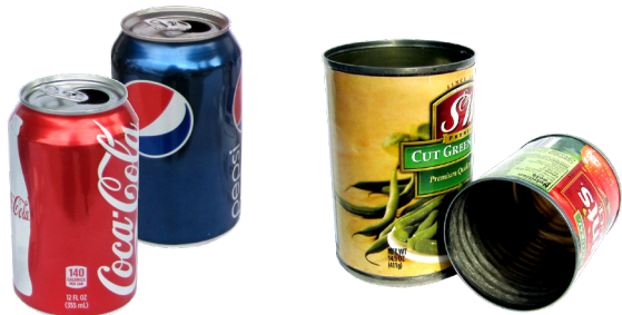
កំប៉ុះអាលុយមីញ៉ូម