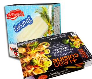
ឧនថេនីនោកម្ហូបអាហារកក