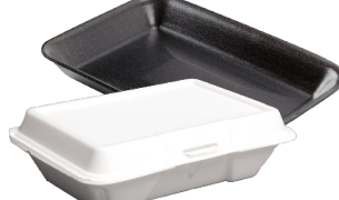
ឧនថេនីស៊ីរ៉ូហ្វូម