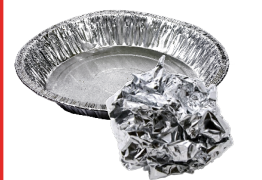
ក្រដាសអាលុយមីញ៉ូម ញីមហ្វាយសំរាប់គ្រប បំប្លែងម្ហូបអាហារ