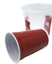
ពែងជីវចាស្និក