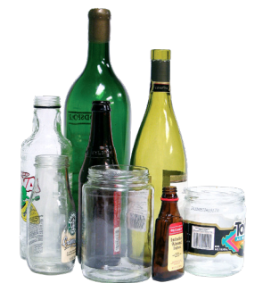
ដបធ្វើពីកែវនិងឡក្រឡ (គ្មានគំរូប)

ស្វែងរកកន្លែងទុកចោលសំរាប់សំរាមទាំងនេះ ថែមទាំងជំរើសសំរាប់គ្រឿងអេឡិចត្រូនិកក្រសំលៀកបំពាក់នៅគេហទំព័រ tacomarecycles.org