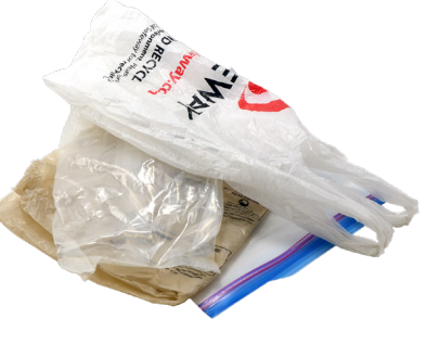
ថង់ប្លាស្ទិកនិងថង់ដេលម៉ាស៊ីនរូតបិទបិក