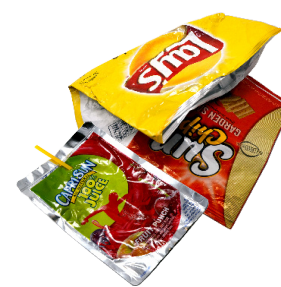
호일 플라스틱 포장