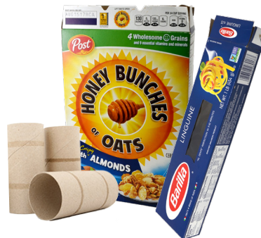
종이 재질 상자 박스