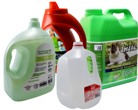
물통 (뚜껑 금지)