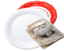
종이 접시 냅킨 페이퍼 타월

일회용 소모품: 생활속에서 다음과 같은 일회용품 사용을 줄이거나 없애기 위하여 웹사이트 Waste Free253.org 에 접속하여 열람하십시오.