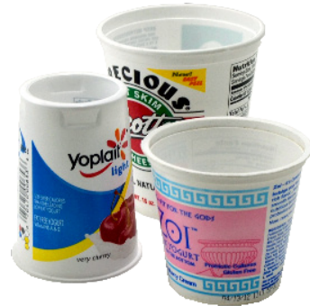
용기 (뚜껑 금지)