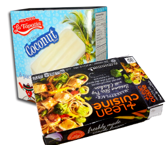
냉동 식품 용기