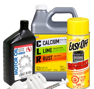
가정에서 발생하는 유해 폐기물