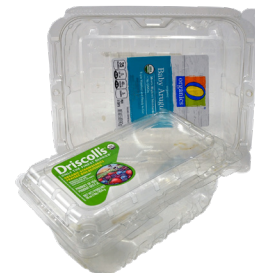
뚜껑이 부착된 플라 스틱 용기