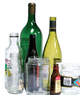
유리병 유리 단지 (뚜껑 금지)

전자 제품, 가전 제품, 침대 매트리스, 의류 등의 물품 폐기 장소에 대하여 더 알고 싶으시면 웹 사이트 tacomarecycles.org 를 열람하십시오.