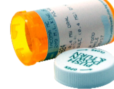
주황색 처방약 병