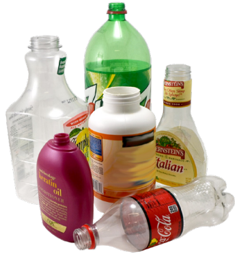
병 (뚜껑 금지)