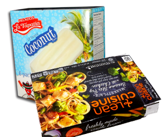
ĐỒ ĐỰNG THỨC ĂN ĐỒNG LẠNH