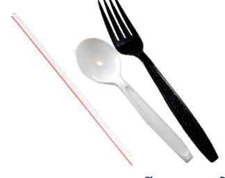
DAO MUỖNG NĨA VÀ ỒNG HÚT NHỰA