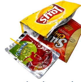
ĐỒ ĐÓNG GÓI BẰNG NHỰA HAY GIẤY BẠC/GIẤY NHÔM