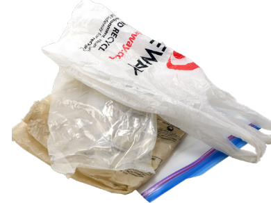
CÁC TÚI NHỰA VÀ TÚI CÓ KÉO KHÓA