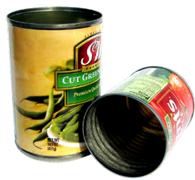
LON KIM LOẠI (KHÔNG CÓ NẮP RỜI)

KHÔNG KIẾNG CÁC MÓN ĐỒ ĐÓNG GÓI CÁC TÚI NHỰA MÚT/XỐP BỌC NHỰA RÁC THẢI TỬ THỰC PHẨM