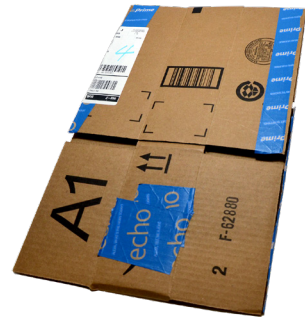
GIẤY BÌA CỨNG ĐÃ XẾP PHẪNG