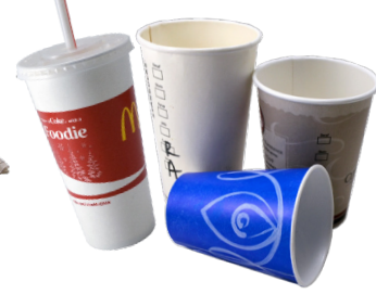
LY TÁCH GIẤY LY TÁCH NHỰA