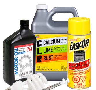
RÁC THẢI ĐỘC HẠI DÙNG TRONG NHÀ

tacomarecycles.org @tacomaes (253) 502-2100