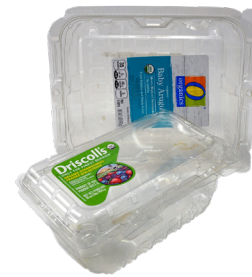
HỘP ĐỰNG LIỀN NẮP BẰNG NHỰA