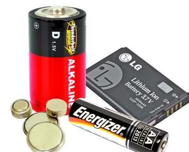
TẤT CẢ CÁC LOẠI PIN