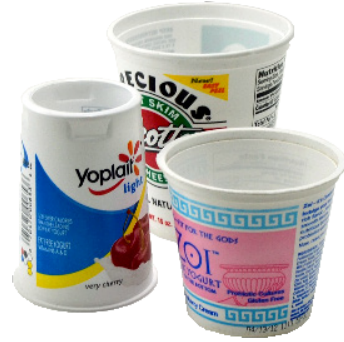
BỒN/CHẬU (KHÔNG NẮP)