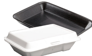
ĐỒ ĐỰNG BẰNG XỐP