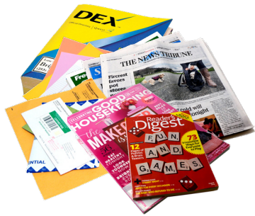
GIẤY CÁC LOẠI