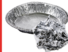
GIẤY BẠC/ GIẤY NHÔM