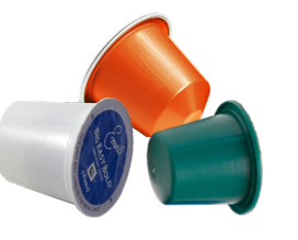
TÚI CÀ PHÊ DÙNG MỘT LẦN