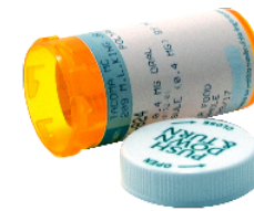
CHAI MÀU CAM ĐỰNG THUỐC THEO TOA