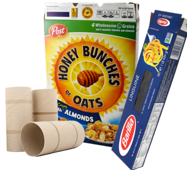
GIẤY BÌA CỨNG VÀ THÙNG/HỘP