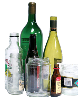
CHAI HŨ BẰNG KIẾNG (KHÔNG NẮP)

Tìm các điểm tập trung những món đồ này thêm các lựa chọn bỏ đồ điện tử, đồ điện gia dụng, nệm, quần áo và những thứ khác tại tacomarecycles.org