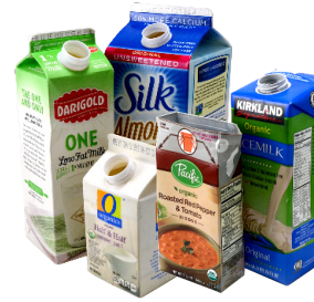
TẤT CẢ CÁC LOẠI HỘP GIẤY